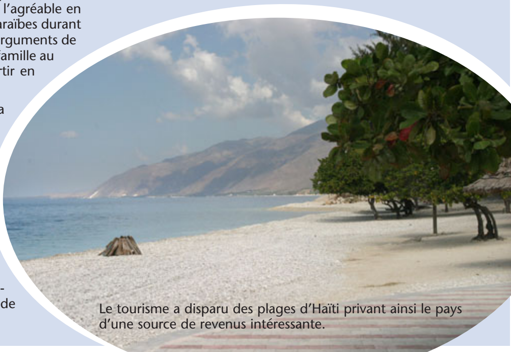
Le tourisme a disparu des plages d'Haïti privant ainsi le pays d'une source de revenus intéressante.