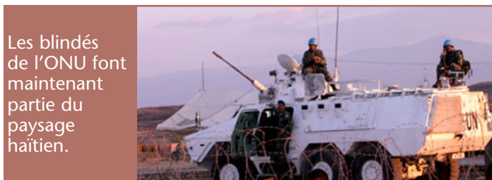
Les blindés de l'ONU font maintenant partie du paysage haïtien.