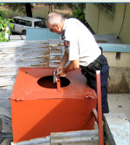
Un policier en train de faire un test balistique avec le réservoir.