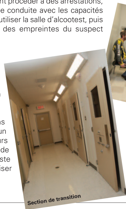
Section de transition