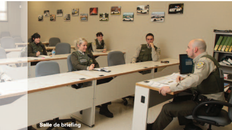
Salle de briefing

Un poste de police est généralement composé de trois secteurs d'activité : la gendarmerie, les enquêtes et le volet administratif.