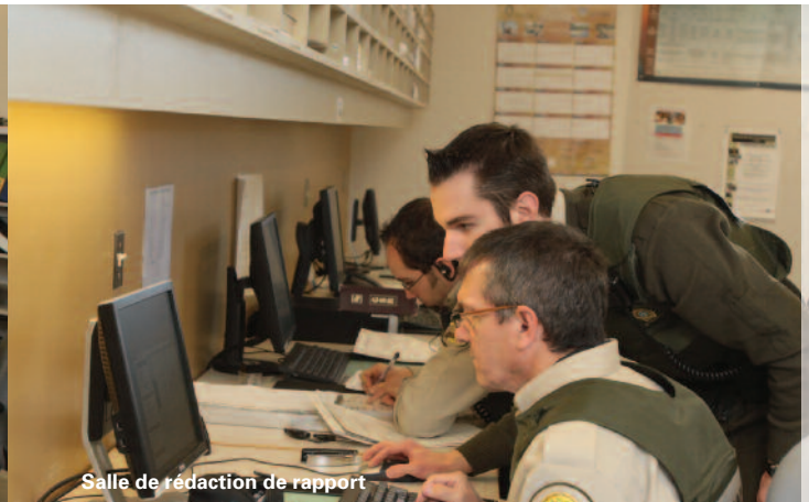
Salle de rédaction de rapport