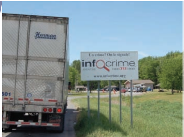
Panneaux ICQ aux haltes routières du ministère des Transports du Québec.