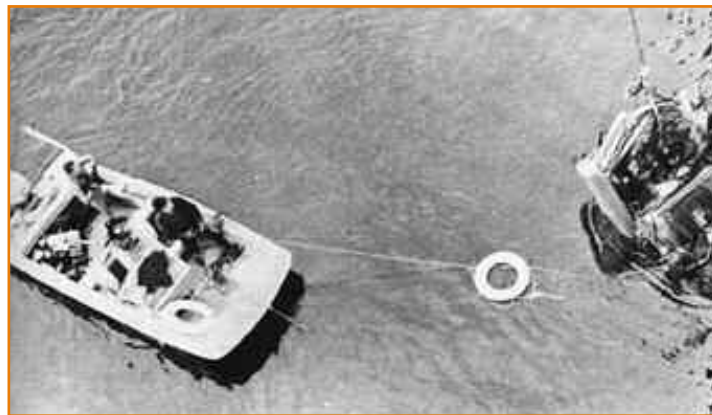
Rivière des Prairies, 1966