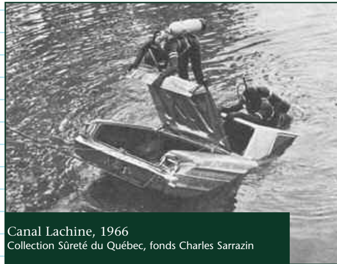
Canal Lachine, 1966

vergent vers les rivières Saint-Charles et Jacques-Cartier. Sarrazin et Lamoureux tentent, mais en vain, de retrouver ces jeunes. C'est la toute première fois que des hommes-grenouilles travaillent dans la région de Québec. Jusqu'alors, les recherches les confinent à la grande région de Montréal.